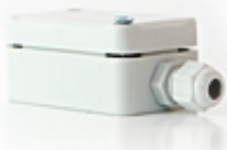
Czujnik temperatury pokojowej CTP-02 (z płynną regulacją +/- 3°C)