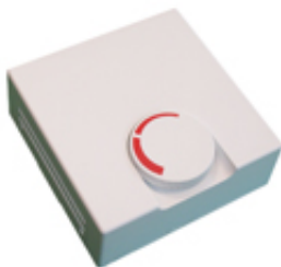
Bezprzewodowy czujnik temperatury pokojowej CTP-02R (z płynną regulacją +/- 3°C)