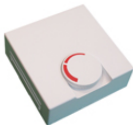
Bezprzewodowy czujnik temperatury pokojowej CTP-02R (z płynną regulacją +/- 3°C)