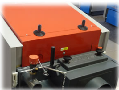
Pętla chłodząca przeciwko przegrzaniu