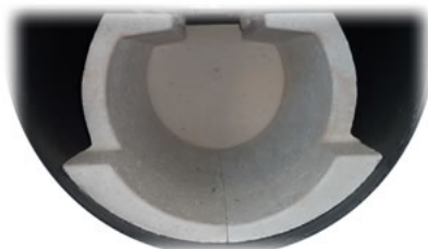
Widok dolnej komory do dokładania