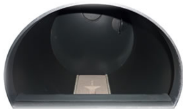
Widok górnej komory do dokładania