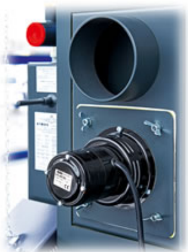
Wentylator odciągu minimalizuje dymienie podczas dokładania i pracy kotła