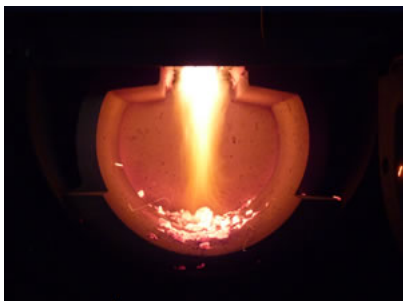
Płonące płomienie w dolnej komorze spalania w przestrzeni kulistej