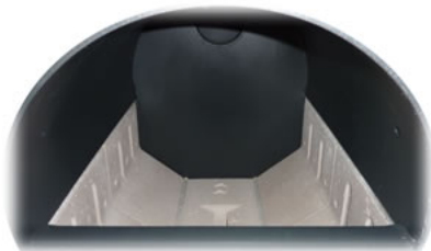
Widok górnej komory do dokładania