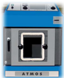
Adaptacja na palnik na pelety