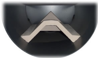
Widok dolnej komory do dokładania