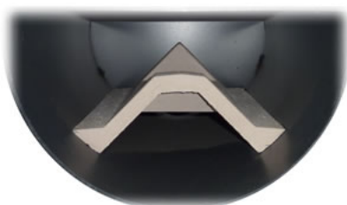
Widok dolnej komory do dokładania