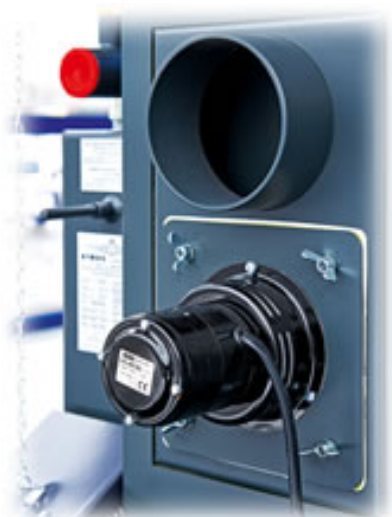
Wentylator odciągu minimalizuje dymienie podczas dokładania i pracy kotła