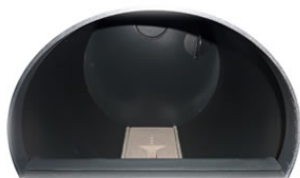
Widok górnej komory do dokładania