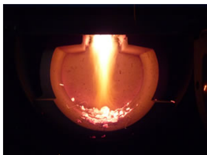
Płonienie płomienia w dolnej komorze spalania w przestrzeni kulistej